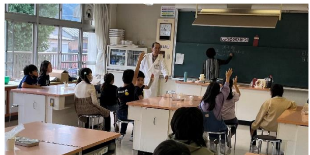
3年しょう油博士の出前授業

やっと「秋といえば」を思い浮かべるのにふさわしい気候になったところですが、秋が短くなったという言葉も最近よく耳にします。暦の上での話と体感は大きくずれてきていますが、11月8日(水)が立冬です。過ごしやすいうちに、ぜひ学校の様子、お子様の様子を見にいらしてください。授業で扱っている内容や廊下の掲示物にも季節感が見られます。同じ掲示物が貼られている期間は意外と短いので、月1回ならもちろん、2週間空けば校内の色々な場所が変わっています。ちょっとした話題の共有にも、どんどん学校を活用してください。