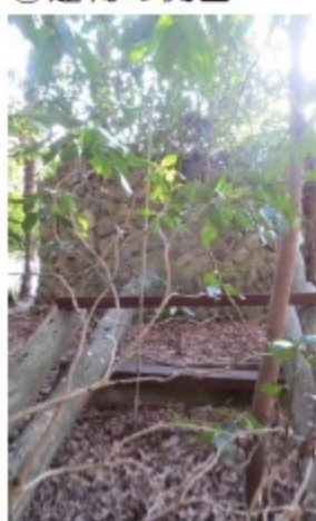
⑦ ⑥を正面から見たところ

1月26日(木)、「田代よいとこ」その6(平成26年9月号)で取り上げて以来ずっと気になっていた田代第二発電所跡を訪ねました。幸い渇水期、さらに草木が枯れた時期だったので、川を渡ってみました。