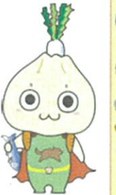
かながわ食育マスコット かなふう

主催: 神奈川県教育委員会 共催: 神奈川県学校栄養士協議会 公益財団法人神奈川県学校給食会 神奈川県農業協同組合中央会 カゴメ株式会社 後援: 公立大学法人神奈川県立保健福祉大学 神奈川新聞社 協賛: 味の素株式会社川崎事業所 神奈川東部ヤクルト販売株式会社 神奈川中央ヤクルト販売株式会社 小田原ヤクルト販売株式会社 厚木ヤクルト販売株式会社 湘南ヤクルト販売株式会社 富士シティオ株式会社 イオンリテール株式会社