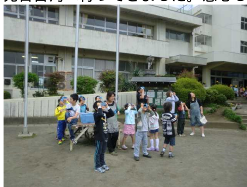
登校してから 金環日食後の太陽を観察

のは、街がきれいだということ。日本では幹線道路の植え込みによく空き缶やペットボトルの空き容器が投げ込まれていますが、台湾ではそういったことはありませんでした。自然に対する畏敬の念が大切にされているのでしょう。見習わなければと思った4日間でした。