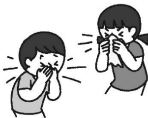
咳やくしゃみ、鼻をかんだとき