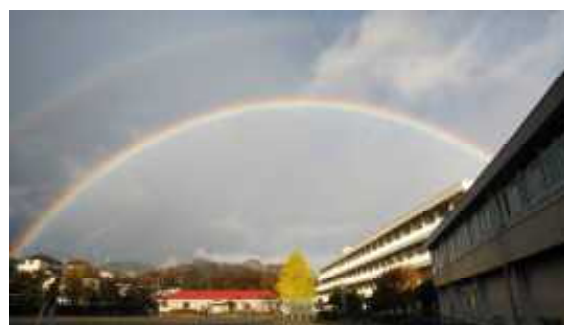
【12月2日 W虹】(地域の方から)