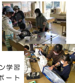
ミシン学習 サポート