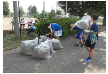
次々に運ばれてきました。