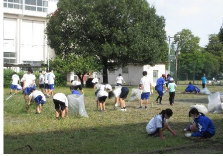
「さあ、きれいにするぞー！！」