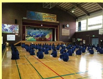
2学年 終業式の様子