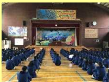
1, 3学年 終業式の様子

12月24日の終業式は、コロナウィルス感染症拡大防止のため、学年を分けて行われました。前半は1、3年生、後半は2年生でした。どちらの式でも校長先生からの2学期をしめくくるお話の後、各学年の代表者による2学期の振り返りと3学期に向けての決意が発表されました。