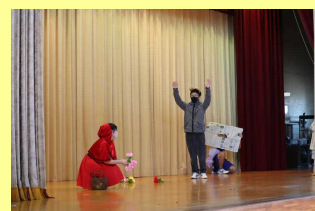
3学年 学年委員による演劇

12月24日の終業式は、コロナウィルス感染症拡大防止のため、学年を分けて行われました。前半は1、3年生、後半は2年生でした。どちらの式でも校長先生からの2学期をしめくくるお話の後、各学年の代表者による2学期の振り返りと3学期に向けての決意が発表されました。