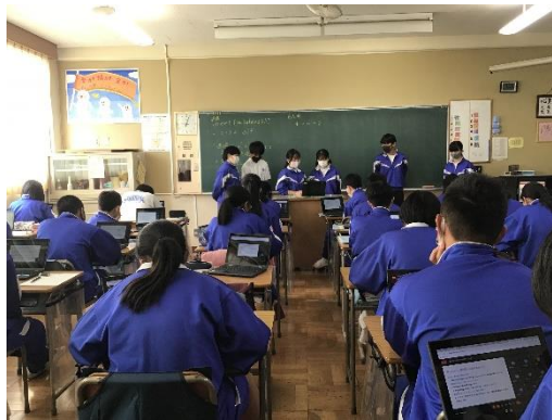
2年生 各クラス発表