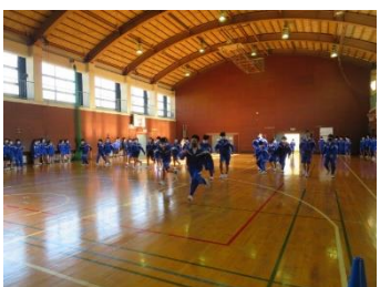
3年生 学年レクリエーション 「だるまさんが ころんだ」