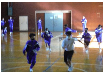
1年生 学年レクリエーション 「借りもの競走」

12月24日に、各学年で学年集会やレクリエーションが行われました。どの学年も楽しそうにレクリエーションを行っていました。終業式は新型コロナウイルス感染症拡大防止のため、学年を分けて行われました。前半は3年生、後半は1・2年生でした。どちらの式でも校長先生から2学期を締めくくるお話の後、各学年の代表者による2学期の振り返りと3学期に向けての決意が発表されました。