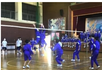
2年生 学年レクリエーション 「バレーボール」