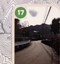
17 歩道がないので車が通る時に危険な思いをするよ。