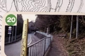
20 歩道が狭く外灯がないので夜は暗い、車も多く出る。