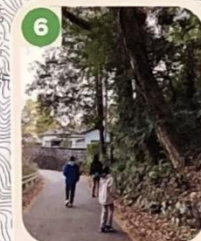
6 土砂崩れと倒木の危険があるので注意しよう。