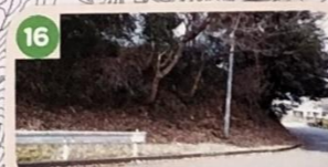
16 土砂くずれと倒木の危険があるので注意しよう。