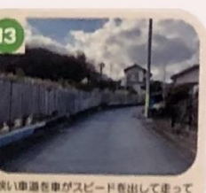
13 狭い車道を車がスピードを出して走ってくるから注意しよう。