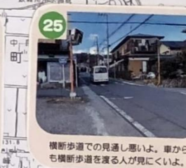
25 横断歩道での見通し悪いよ。車からも横断歩道を渡る人が見にくいよ。