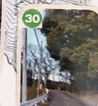
30 道がカーブになっているため車が見にくいよ。