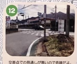
12 交差点での見通しが悪いので危険だよ。