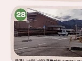
28 見通しは良いが交通量が多く車が止まらせないよ。