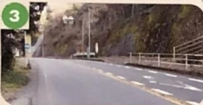
3 ガードパイプがなく車のコンクリートが劣化し危険。