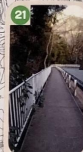
21 外灯がないので、夕方や夜は暗いので注意。