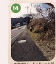
14 歩道が狭く、ガードレールがないので下ってくる車に注意しよう。