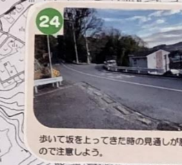
24 歩いて坂を上ってきた時の見通しが悪いので注意しよう。