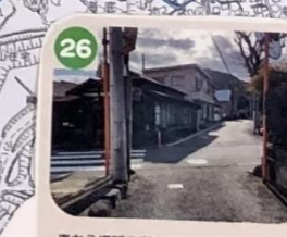
26 車から横断歩道を渡る人が見にくいよ。