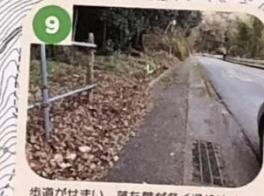
9 歩道がせまい、落ち葉が多く滑りやすいので注意しよう。