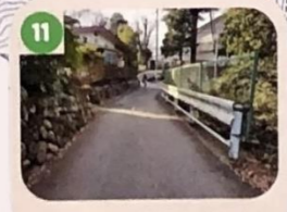
11 歩道がせまいので車を通ると危ないよ。