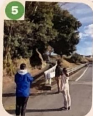
5 歩道に木が倒れ出し、くずれそうなので注意しよう。