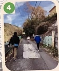
4 人と車が少なくて、倒木の危険があるので注意しよう。