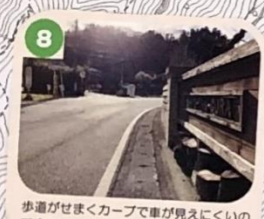
8 歩道がせまくカーブで車が見えにくいので注意しよう。