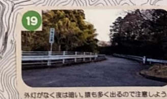
19 外灯がなく夜は暗い、車も多く出るので注意しよう。