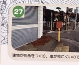
27 障害物が死角をつくり、車が見にくいので注意しよう。