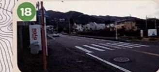
18 下ってくる車が横断歩道に気づくのが遅いので注意。