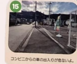
15 コンビニからの車の出入りが危ないよ。