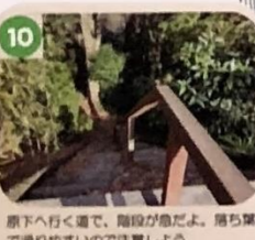
10 南下へ行く道で、階段が急だよ。落ち葉で滑りやすいので注意しよう。