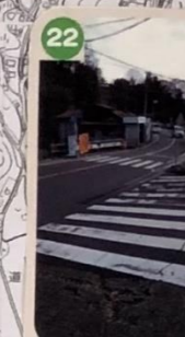
22 交通量が多く、車が止まってくれない時が多いので注意。