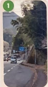
1 木や竹が歩道にはみ出し 倒木の恐れがあり危険だよ。