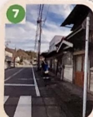
7 歩道と車道が狭いため、車とすれ違う時には注意しよう。