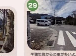
29 半環状からの車が多いよ。半環状で横断歩道がないので注意しよう。